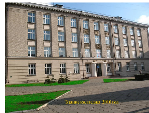
Здание колледжа 2010 год