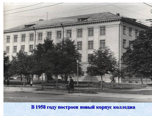
В 1958 году построен новый корпус колледжа